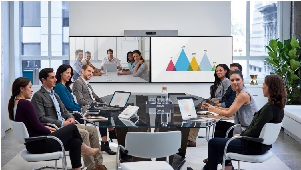
图 1. 用于大型会议室的思科 Webex Room Kit Plus

Room Kit Plus - 包括一个强大的编解码器和一个内置 4 个高清摄像机的镜头矩阵，集成扬声器和麦克风，非常适合大中型会议室使用。它采用先进的摄像机技术，使大中型会议室环境也能实现发言者跟踪和自动取景功能（跟踪距离可至 9 米）。在保证丰富的功能和体验的同时，该产品在定价和设计上也经过仔细考量，可确保轻松扩展到您的所有会议室和空间，无论您是选择自建部署注册还是通过思科® 协作云注册到思科 Webex，都能获得这些优势。